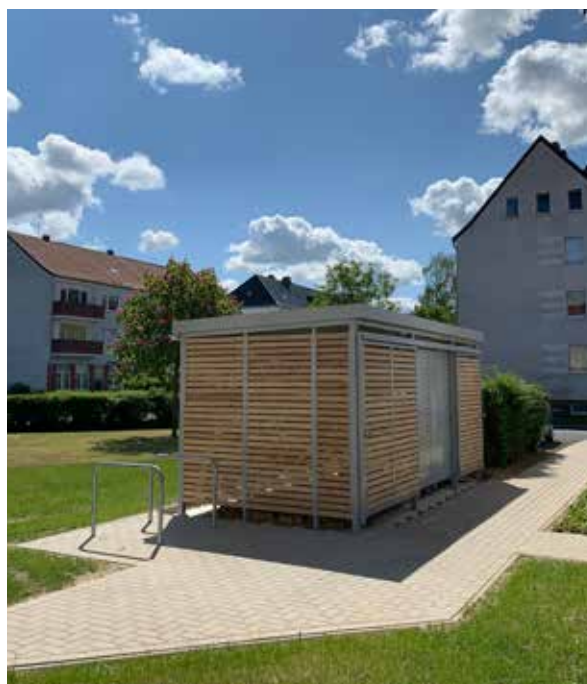
Lessingstraße 5, 7