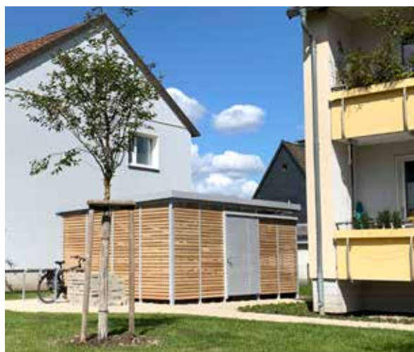
Lessingstraße 1, 3