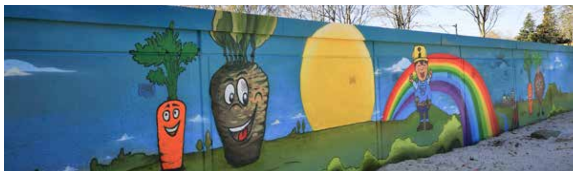
Vorher und nachher: Neues Graffiti an der Heinrich-Heine-Straße 10, 11 und 12